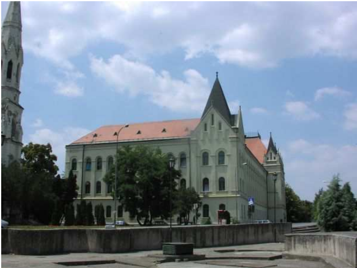
Зграда правосудних органа у Зрењанину, Кеј 2. октобра бр. 1